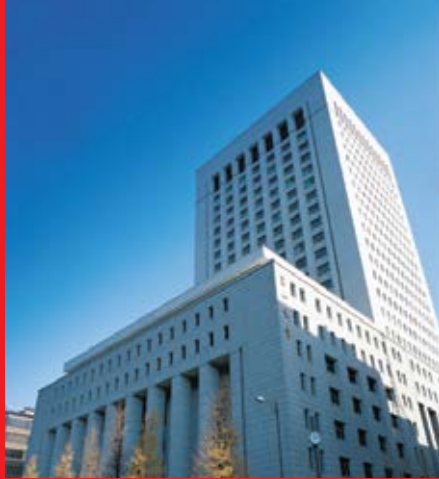
Tòa nhà trụ sở Dai-ichi Life Holdings tại Tokyo, Nhật Bản