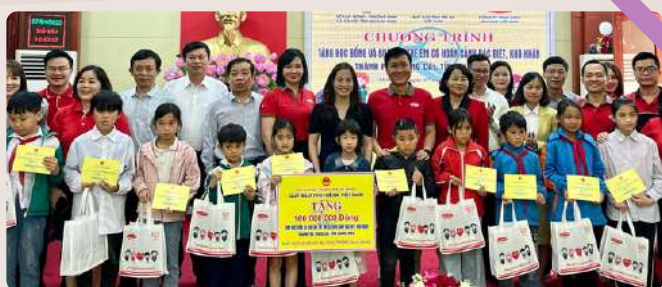
Đại diện Dai-ichi Life Việt Nam trao tặng quà khuyến học và dinh dưỡng cho các em học sinh.

Dự án " Nước sạch học đường " được Dai-ichi Life Việt Nam khởi xướng từ năm 2012. Đến nay, dự án đã lắp đặt 125 hệ thống máy lọc nước uống sạch và 11 công trình nước sạch với tổng trị giá gần 7 tỷ đồng , cung cấp nguồn nước uống sạch cho hơn 40.000 học sinh và giáo viên .