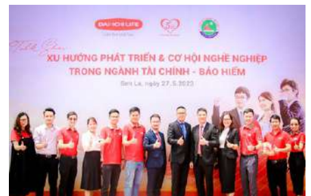
Và Trường Đại học Tây Bắc, tỉnh Sơn La ngày 27/5/2023.