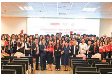
Talkshow diễn ra rất sôi nổi với sự tham gia nhiệt tình của sinh viên Khoa Bảo hiểm - Trường Đại học Kinh tế Quốc dân Hà Nội vào ngày 7/4/2023.

Các diễn giả đến từ Dai-ichi Life Việt Nam đã chia sẻ xu hướng phát triển, cơ hội nghề nghiệp và giải đáp rất nhiều câu hỏi của sinh viên, đồng thời giới thiệu các thông tin tuyển dụng hấp dẫn của Dai-ichi Life Việt Nam.