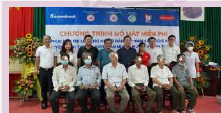
Mổ mắt miễn phí cho bệnh nhân tại tỉnh Kiên Giang.

Hoạt động này nằm trong Chương trình Mổ mắt miễn phí – " Phục hồi thị lực cho người dân có hoàn cảnh khó khăn ", với tổng ngân sách 1 tỷ đồng do Dai-ichi Life Việt Nam và Sacombank phối hợp triển khai nhân kỷ niệm 5 năm hợp tác thành công.