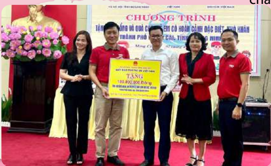
Các vị lãnh đạo và đại diện đơn vị nhà tài trợ cùng chụp hình lưu niệm với các em học sinh tại buổi Lễ.

Đây là năm thứ 6 liên tiếp Quý " Vì cuộc sống tươi đẹp " đồng hành cùng Quý Bảo trợ Trẻ em Việt Nam trong công tác chăm sóc trẻ em và hỗ trợ giáo dục với tổng số tiền tài trợ 3,3 tỷ đồng .