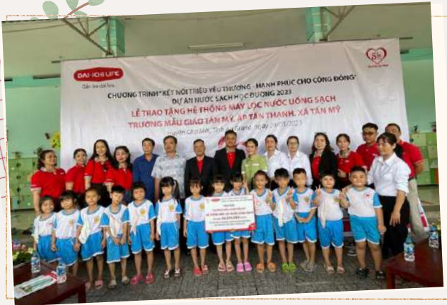
Lễ bàn giao hai hệ thống máy lọc nước uống sạch cho trường Mẫu giáo Tấn Mỹ, tỉnh An Giang.

Ngày 24/3/2023, Dai-ichi Life Việt Nam đã tổ chức lễ bàn giao 2 hệ thống máy lọc nước uống sạch trị giá gần 60 triệu đồng cho trường Mẫu giáo Tấn Mỹ và trường Tiểu học A Tấn Mỹ, huyện Chợ Mới, tỉnh An Giang. Ước tính trung bình hai hệ thống máy lọc nước này sẽ cung cấp 720.000 lít nước uống sạch trong một năm cho gần 400 học sinh và giáo viên tại hai trường.