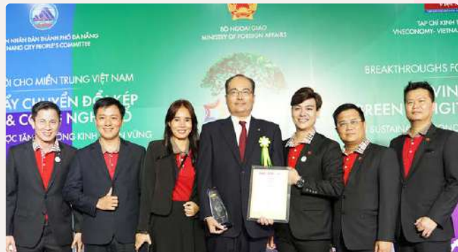
Các thành viên Dai-ichi Life Việt Nam tại Lễ trao giải thưởng Rồng Vàng 2023.