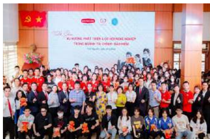
Chương trình tiếp tục đến với sinh viên Trường Đại học Kinh tế và Quản trị Kinh Doanh Thái Nguyên, ngày 26/5/2023.