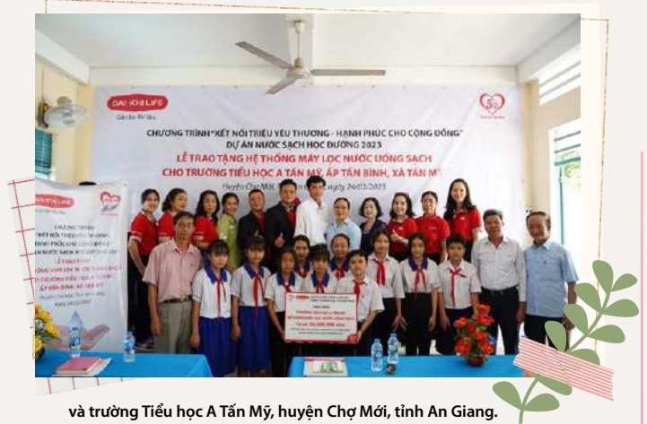
và trường Tiểu học A Tấn Mỹ, huyện Chợ Mới, tỉnh An Giang.