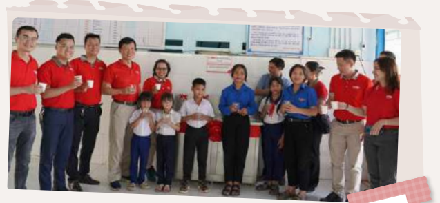
Đại diện Dai-ichi Life Việt Nam cùng các em học sinh thưởng thức nguồn nước uống sạch từ hệ thống máy vừa được trao tặng.

Ngày 9/6/2023, Dai-ichi Life Việt Nam đã trao tặng 2 hệ thống máy lọc nước uống sạch cùng 405 phần quà khuyến học và dinh dưỡng với tổng trị giá 226 triệu đồng cho Trường Phổ thông Dân tộc Bán trú Tiểu học và Trung học Cơ sở Trà Vinh - một trong những trường vùng cao khó khăn của tỉnh Quảng Nam.