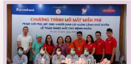
Phục hồi thị lực cho người dân tại tỉnh Tây Ninh.