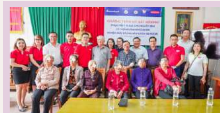
Mang ánh sáng cho bệnh nhân có hoàn cảnh khó khăn tại tỉnh Lâm Đồng.