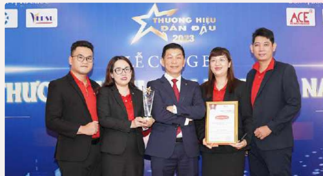
Các thành viên Dai-ichi Life Việt Nam tại Lễ Công bố “Top 10 Thương hiệu Dẫn đầu Việt Nam 2023”.