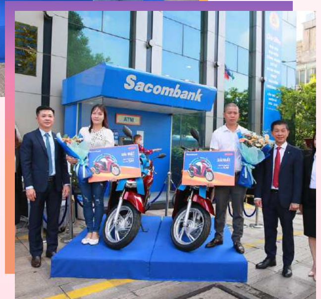
Các khách hàng trúng thưởng Giải Nhất và Giải Nhì của chương trình.