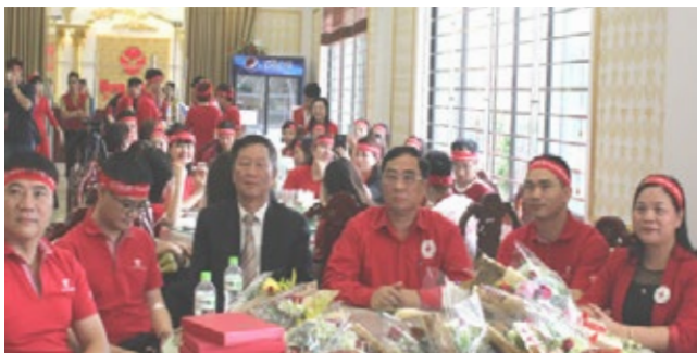
Các đại biểu tham dự chương trình.

Được khởi xướng từ năm 2009, đây là năm thứ 11 liên tiếp Dai-ichi Life Việt Nam triển khai chương trình nhân văn này với tổng cộng 3.323 đơn vị máu (tương đương 1.032.750 ml) đã được hiến tặng cho đến nay, thể hiện sâu sắc triết lý kinh doanh “Tất cả vì con người” và trách nhiệm xã hội doanh nghiệp của công ty.