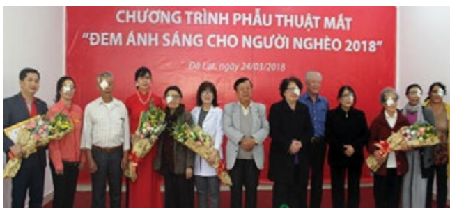
Các bệnh nhân được mổ mắt chụp hình lưu niệm cùng đại diện Quỹ "Vi cuộc sống tươi đẹp" và các y, bác sĩ.

Ngày 24/3 và 21/4/2018, Quỹ "Vi cuộc sống tươi đẹp" đã phối hợp cùng Hội Bảo trợ Bệnh nhân nghèo TP. HCM, Hội Bảo trợ Bệnh nhân Nghèo - Người Tàn tật và Trẻ Mồ côi, các y bác sĩ Bệnh viện Nguyễn Trãi TP. HCM, Bệnh viện tại tỉnh Lâm Đồng và tỉnh Long An tiến hành phẫu thuật miễn phí cho hơn 200 bệnh nhân nghèo bị đục thủy tinh thể.