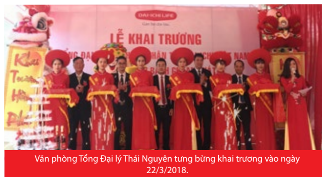
Văn phòng Tổng Đại lý Thái Nguyên tung bồng khai trương vào ngày 22/3/2018.