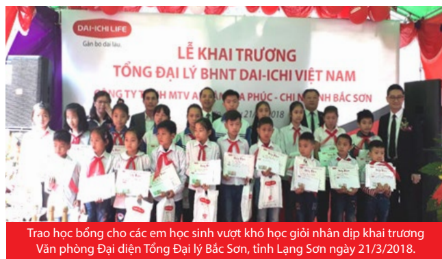
Trao học bổng cho các em học sinh vượt khó học giỏi nhân dịp khai trương Văn phòng Đại diện Tổng Đại lý Bắc Sơn, tỉnh Lạng Sơn ngày 21/3/2018.