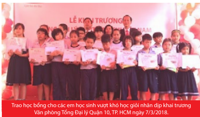
Trao học bổng cho các em học sinh vượt khó học giỏi nhân dịp khai trương Văn phòng Tổng Đại lý Quận 10, TP. HCM ngày 7/3/2018.

Như vậy, tính đến cuối tháng 4/2018, Dai-ichi Life Việt Nam đã chính thức đưa vào hoạt động 272 văn phòng và Tổng đại lý, hân hạnh phục vụ hơn 2 triệu khách hàng thông qua đội ngũ hơn 75.000 tư vấn tài chính chuyên nghiệp và 1.200 nhân viên.