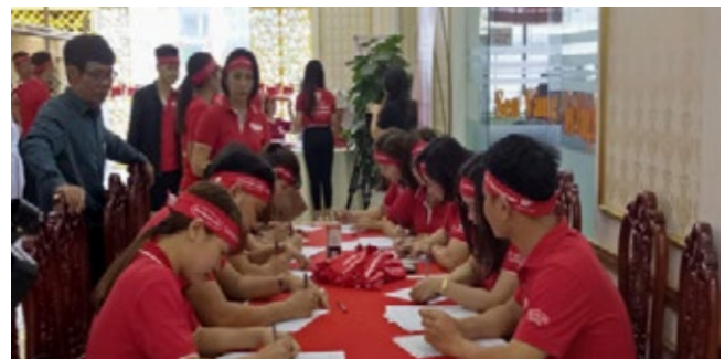
Hơn 200 tình nguyện viên của Dai-ichi Life Việt Nam đăng ký tham gia hiến máu.