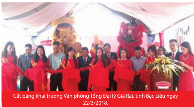
Cắt băng khai trương Văn phòng Tổng Đại lý Giá Rai, tỉnh Bạc Liêu ngày 22/3/2018.