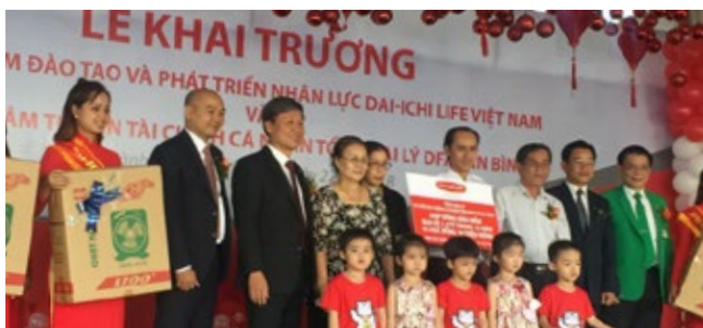
Cắt băng khai trương Trung tâm Tư vấn Tài chính Cá nhân Tổng Đại lý DFA Tân Bình ngày 22/2/2018.

Tiếp tục chiến lược mở rộng quy mô hoạt động và nâng cao chất lượng phục vụ khách hàng, trong 4 tháng đầu năm 2018, Dai-ichi Life Việt Nam đã khai trương thêm 13 Văn phòng thuộc hệ thống Tổng Đại lý của công ty tại Quận 10 và DFA Quận Tân Bình (TP. HCM), TP. Tây Ninh (tỉnh Tây Ninh), TP. Trà Vinh (tỉnh Trà Vinh), TP. Lào Cai (tỉnh Lào Cai), Thị xã Từ Sơn (tỉnh Bắc Ninh), Huyện Bắc Sơn (tỉnh Lạng Sơn), Thị xã Giá Rai (tỉnh Bạc Liêu), TP. Thái Nguyên (tỉnh Thái Nguyên), Huyện Thanh Miện (tỉnh Hải Dương), Huyện Thanh Ba (tỉnh Phú Thọ), Quận Long Biên (TP. Hà Nội) và Huyện Duy Xuyên (tỉnh Quảng Nam). Nhân dịp khai trương các văn phòng, Dai-ichi Life Việt Nam đã trao tặng 240 suất học bổng trị giá 120 triệu đồng cho