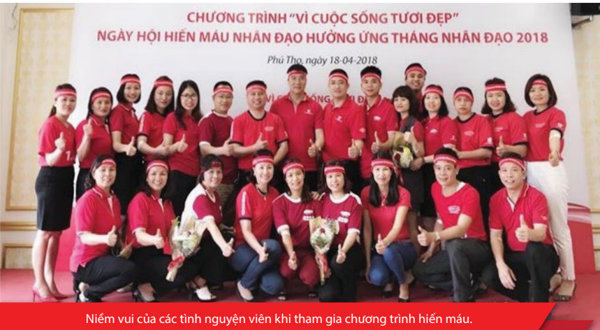
Niềm vui của các tình nguyện viên khi tham gia chương trình hiến máu.

Ngày 15/1/2018, tại Văn phòng Trụ sở chính TP. HCM, Dai-ichi Life Việt Nam phối hợp cùng Hội Chữ thập đỏ quận Phú Nhuận khởi động chương trình “ Vì cuộc sống tươi đẹp ” – Hiến máu nhân đạo 2018 chào mừng kỷ niệm 11 năm thành lập công ty (18/1/2007 – 18/1/2018).