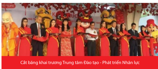
Cắt băng khai trương Trung tâm Đào tạo - Phát triển Nhân lực

Nhằm nâng cao chất lượng đào tạo đội ngũ nhân lực phù hợp với xu hướng thị trường, đáp ứng tốt nhất nhu cầu ngày càng đa dạng của khách hàng, vào ngày 22/2/2018, Dai-ichi Life Việt Nam đã khai trương Trung tâm Đào tạo - Phát triển Nhân lực (Dai-ichi Life Vietnam Academy Center) tọa lạc tại tầng M, Gala Center, 415 Hoàng Văn Thụ, phường 2, quận Tân Bình, TP. HCM.